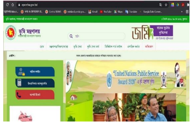
ডিজিটাল রেকর্ড রুম সাইটের একাংশ

কাজক্ষিত খতিয়ান ও মৌজা ম্যাপ সহজেই খুঁজে পান এবং অনলাইন কপি প্রাপ্তিসহ সার্টিফাইড কপির জন্য অনলাইনে ফি প্রদান করে আবেদন করতে পারছেন। ইতোমধ্যে ২১ টি জেলার ১১৩৯৫৭৭ টি বিএস, ৩৮১৯৭৫৯ টি সিএস, ৬৯১৬৩৩৯ টি আর এস, ৯২১৮৯৮৩ টি এসএ, ৩৭৬২৬ টি পেটি, ৫৮৭২৮ টি দিয়ারাসহ সর্বমোট ২১২৪১০১২ টি খতিয়ান আপডেট করা হয়েছে।