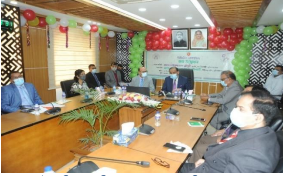
'হাতের সুঠোয় ভূমিসেবা' প্রতিপাদকে সামনে রেখে ভূমি মন্ত্রণালয়ের সম্মেলন কক্ষে ডিজিটাল বাংলাদেশ বিনির্মাণে বাংলাদেশের ২১টি জেলার রেকর্ড রুমের নাগরিক সার্ভিস ই-সার্ভিস বা ডিজিটাল সার্ভিসে রূপান্তরের কার্যক্রমের উদ্বোধন করেন মাননীয় ভূমিমন্ত্রী সাইফুজ্জামান

গ) বর্তমান অবস্থা: ডিজিটাল রেকর্ড রুম সংক্রান্ত সেবা www.eporcha.gov.bd সাইটের মাধ্যমে উন্মুক্ত করা হয়েছে। নাগরিকদের জন্য এই সেবা প্রাথমিকভাবে ২১ (একুশ) টি জেলা (ঢাকা, ফরিদপুর, নরসিংদী, গোপালগঞ্জ, টাঙ্গাইল, শরীয়তপুর, কিশোরগঞ্জ, মাদারীপুর, নারায়ণগঞ্জ, রাজবাড়ী, মানিকগঞ্জ, চট্টগ্রাম, সিলেট, মৌলভীবাজার, হবিগঞ্জ ময়মনসিংহ, নেত্রকোণা, পঞ্চগড়, কুড়িগ্রাম, রংপুর ও সিরাজগঞ্জ)-র জরিপের খতিয়ান ও মৌজা ম্যাপ এই সিস্টেমে উন্মুক্ত করা হয়েছে। বর্ণিত সাইট হতে নাগরিকগণ